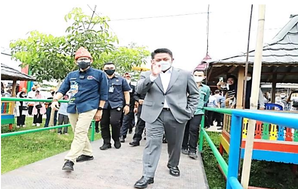
Kegiatan Pemerintahan bersama dengan Bapak Sandiaga Uno dan Bapak Herman Deru di Desa Burai Kecamatan Tanjung Batu Kabupaten Ogan Ilir

Kegiatan pemerintahan seperti rapat-rapat dinas dan upacara hari-hari besar (HUT Kabupaten Ogan Ilir, kegiatan festival) yang diselenggarakan di desa wisata Burai. Kegiatan HUT Kabupaten Ogan Ilir dapat dijadikan sebagai media promosi yang efektif untuk memperkenalkan potensi-potensi Desa Wisata Burai kepada masyarakat luas.