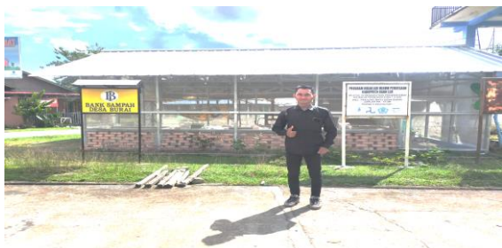
Program Hibah Air Minum Perdesaan Kabupaten Ogan Ilir

Berdasarkan hasil wawancara di atas penulis dapat menyimpulkan bahwa Peran Pemerintah Desa sebagai motivator sudah berperan aktif dengan memberikan dukungan dan bantuan kepada masyarakat Desa Burai. Melalui pengajuan proposal ke Kabupaten Ogan Ilir, pemerintah desa juga bekerja sama dengan PT. Pertamina dalam pembuatan fasilitas gazebo dan bekerja sama dengan Kabupaten Ogan Ilir dalam program Hibah Air Minum Perdesaan Kabupaten Ogan Ilir. Selain itu dengan pembentukan lembaga desa, Desa Burai terpilih sebagai 50 desa wisata terbaik se-