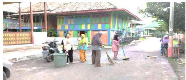
Sumber: Gotong Royong Membersihkan Lingkungan di Desa Burai Kecamatan Tanjung Batu Kabupaten Ogan Ilir

Peran pemerintah desa sebagai dinamisator adalah menggerakkan partisipasi masyarakat jika terjadi kendala-kendala dalam proses pembangunan untuk mendorong dan memelihara dinamika pembangunan daerah. Pemerintah desa berperan melalui pemberian pembinaan secara intensif dan efektif kepada masyarakat.