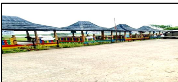
Sumber: Fasilitas Gazebo yang berada di Desa Burai

Fasilitas ketersediaan gazebo merupakan salah satu sarana yang penting dalam aspek destinasi wisata guna memfasilitasi para wisatawan yang berkunjung. Berdasarkan observasi lapangan, sarana gazebo di Desa wisata Burai sudah tersedia yang terdiri dari 4 unit. Wisatawan yang datang dapat duduk santai di gazebo yang telah disediakan sambil menikmati pemandangan alam di Desa Burai. Sarana gazebo ini merupakan bantuan dari PT. Pertamina EP Pendopo Field.