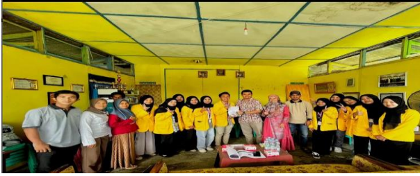
Kegiatan KKN Universitas Sriwijaya Palembang di Desa Burai Kecamatan Tanjung Batu Kabupaten Ogan Ilir

Berdasarkan hasil wawancara di atas Desa Burai sudah bekerja sama dengan universitas yang ada di Palembang seperti Universitas Sriwijaya dan Universitas Islam Negeri (UIN) Raden Fatah Palembang untuk melaksanakan kegiatan program kuliah yaitu KKN.