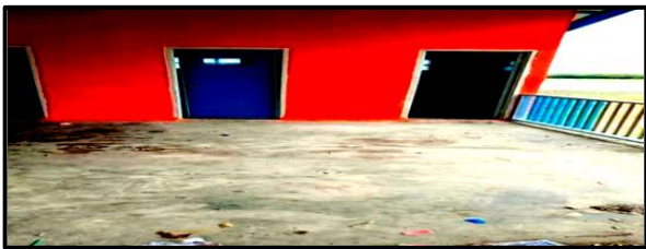
Sumber: Toilet Umum di Desa Burai Kabupaten Ogan Ilir

Toilet umum di kawasan wisata merupakan unsur penting untuk memenuhi kebutuhan MCK oleh wisatawan. Di desa Burai memiliki 4 toilet umum. Lokasi toilet umum berada di Dusun I, namun karena masih minimnya fasilitas yang ada dimana kurang terawatnya toilet tersebut, selain itu masih banyaknya sampah yang berserakan sehingga untuk wisatawan yang ingin menggunakan toilet umum biasa-nya memakai fasilitas masjid tidak jauh dari lokasi wisata yang berada di Dusun II.