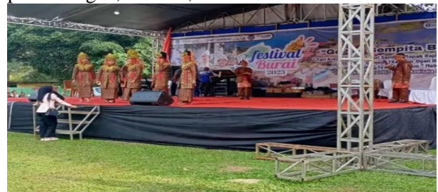
Festival Burai Kecamatan Tanjung Batu Kabupaten Ogan Ilir

Festival/pertandingan secara rutin diselenggarakan kegiatan-kegiatan yang bisa menarik wisatawan atau penduduk desa lain untuk mengunjungi desa tersebut, misalnya mengadakan pertandingan, festival, dan lain-lain.