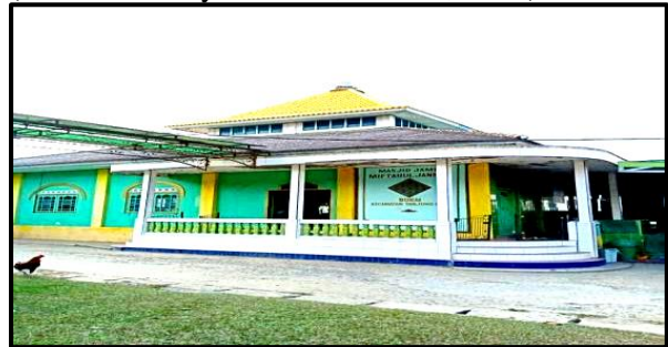
Kondisi Masjid di Desa Burai, 2024

Peran fasilitator merupakan peran pemerintah daerah sebagai penyedia segala fasilitas yang mendukung peningkatan potensi pariwisata yang ada di wilayah otonominya serta dapat mempercepat pembangunan melalui perbaikan lingkungan perilaku daerahnya, peran ini sendiri dapat meliputi proses pembangunan, perbaikan prosedur perencanaan dan penetapan peraturan (Pitana dan Gayatri 2005; Iswanti, 2022).