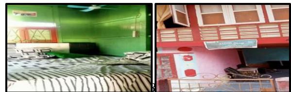
Tanjung Batu Kabupaten Ogan Ilir

Homestay merupakan salah satu bentuk penginapan di mana pengunjung atau tamu akan menginap di kediaman penduduk setempat di kota tempat mereka bepergian. Fasilitas homestay biasanya merupakan apa yang disediakan pemilik di rumah mereka tersebut. Homestay sangat cocok untuk wisata keluarga karena homestay menawarkan fasilitas seperti rumah pribadi pada umumnya. Mulai dari dapur, peralatan rumah tangga, dan sebagainya.