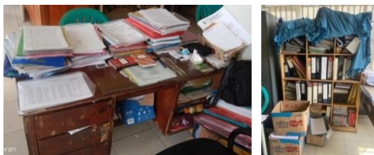
Gambar Kondisi Ruang Penyimpanan Arsip di Kantor Lurah Sako Kota Palembang