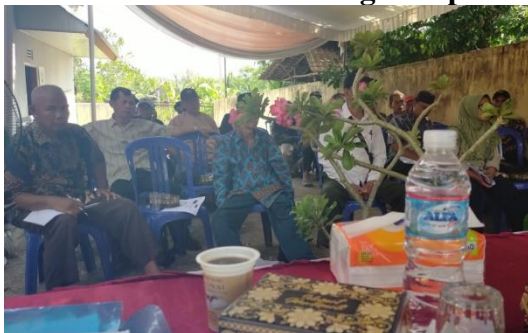
Sumber : Kantor Upt Bapenda Kecamatan Talang Kelapa

Berdasarkan hasil wawancara di atas, penulis berpendapat bahwa peran UPT Bapenda dan Rt Rw dalam mendorong warga melakukan pembayaran tanah dan mematuhi pembayaran dapat digunakan untuk mengevaluasi sikap pelaksana yang menjalankan tugasnya dengan baik. Pajak bangunan.