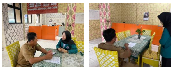
Foto Dengan Sub Bagian Umum Dan Kepegawaian

Berdasarkan hasil wawancara tersebut dapat diketahui bahwa penyampaian informasi di Lingkungan Dinas Sosial Provinsi Sumatera Selatan, telah terlaksana dengan cukup baik dimana informasi Peraturan Pemerintah Nomor 30 Tahun 2019 didapatkan langsung dari BKD kemudian ke Sekretaris Dinas lalu ke Kasubag