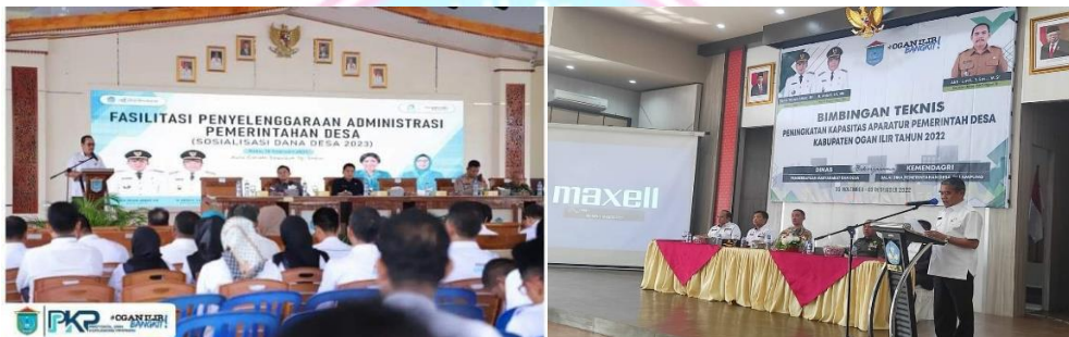
Gambar Kegiatan Sosialisasi dan Bimtek Dana Desa

Implementasi yang efektif terjadi apabila para pembuat keputusan sudah mengetahui apa yang akan mereka kerjakan. Hal ini akan berjalan bila komunikasi juga berjalan dengan baik, kebijakan yang dikomunikasikan harus tepat, akurat dan konsisten.