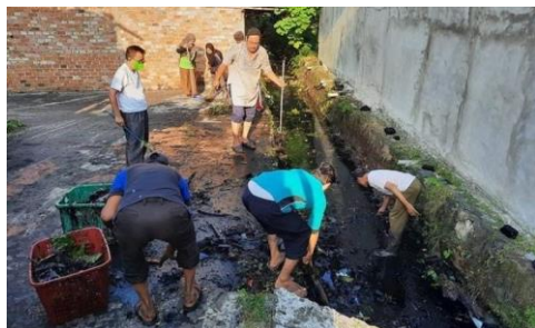
Gambar 4 Sarana dan Prasarana Kegiatan Gotong Royong di Kantor Camat Kecamatan Ilir Bara II Palembang

”sarana dan prasarana dalam mengimplementasikan Peraturan Walikota tentang pelaksanaan gotong royong di Kantor Camat Kecamatan Ilir Barat II Palembang itu telah dicukupi seperti 5 buah sapu, 5 buah sekop, 5 buah cangkul, 5 buah arit, 3 buah gerobak sampah serta 1 buah mobil truk pengangkut sampah untuk fasilitas pembuangan sampah dari kegiatan gotong royong dan tempat kegiatan gotong royong itu berpindah-pindah tempat jadi disesuaikan dengan kebutuhannya.